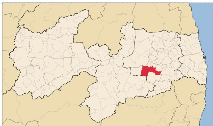
Figura 3. Localização geográfica do município de Campina Grande, PB (WIKIPÉDIA, 2012).

A cidade de Campina Grande localiza-se na Mesorregião do Agreste Paraibano, na parte oriental do Planalto da Borborema (Figura 3). A altitude média é de 552 metros acima do nível do mar e distante 120 km da capital do Estado. Considerada a segunda maior cidade do estado, tem uma população estimada em 405.072 habitantes (IBGE, 2015) em uma área territorial de 594,182 km 2 .