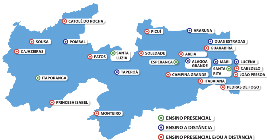
Figura 1 - Quadro de Abrangência do IFPB

Com o Plano de Expansão da Educação Profissional - Fase III, do governo federal, que foi até o final de 2014, o Instituto implantou um campus na cidade de Guarabira, o Campus Avançado Cabedelo Centro e viabilizou o funcionamento de mais dez unidades, a saber: Areia, Catolé do Rocha, Esperança, Itabaiana, Itaporanga, Mangabeira, Pedras de Fogo, Santa Luzia, Santa Rita e Soledade. Essas novas unidades levam educação em todos os níveis a essas localidades oportunizando o desenvolvimento econômico e social e melhorando a qualidade de vida nessas regiões.