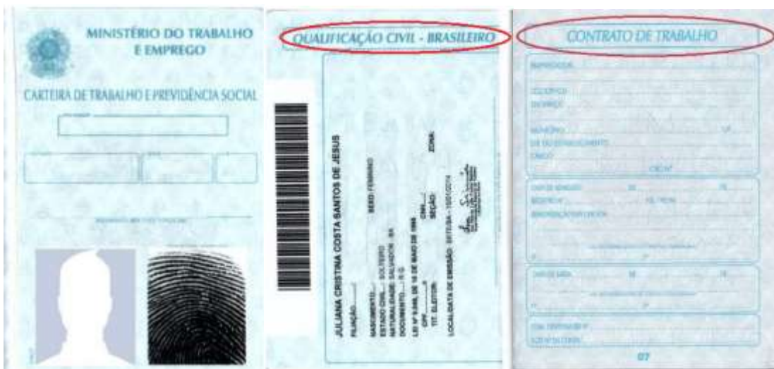
Figura 3: Página de identificação.